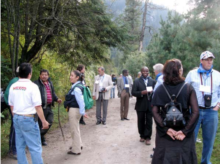
2008年11月第六次年度研讨会期间，与会者参观墨西哥城近郊的“迪纳摩”国家保护区

会议为期五天，与会者超过200人；主讲人包括学者、法官、政治家、政府领导人、非政府组织和社会团体的代表，他们从自身经验出发，从各种不同的角度为大会的主题进行了诠释。本次会议记录将在2010年由Edward Elgar出版公司发行。