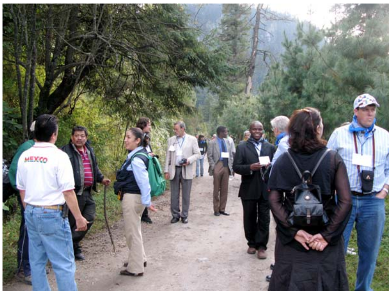
Viaje de estudio a “Los Dinamos”, Ciudad de México, durante el Sexto Coloquio Anual, noviembre de 2008

Más de 200 participantes tomaron parte en el evento de 5 días al que asistieron distinguidos ponentes de la academia, así como líderes de la justicia, la política y el gobierno, organizaciones no-gubernamentales y líderes del sector privado, que ofrecieron una gama de perspectivas y una vasta experiencia sobre los temas de la conferencia. Las deliberaciones de este coloquio serán publicadas por Edward Elgar en 2010.