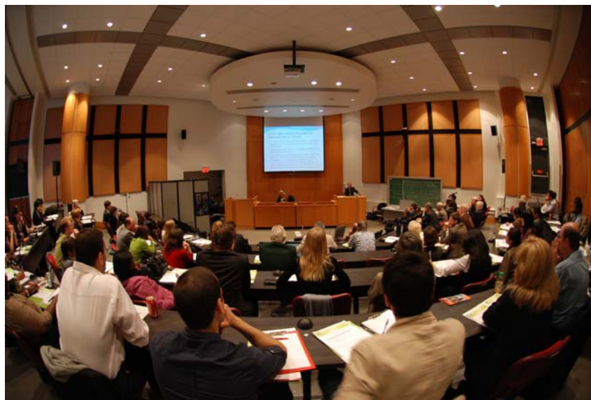
Sesión plenaria, Derecho del cambio climático en países en desarrollo, septiembre de 2008, Universidad de Ottawa

En junio del 2008, la Academia de la UICN fue sede de un taller sobre Ley y políticas sobre áreas protegidas, así como de una reunión del Grupo de trabajo conjunto de la CDA (Comisión de Derecho Ambiental) y la CMAP (Comisión Mundial de Áreas Protegidas) sobre Áreas Protegidas. Las reuniones estuvieron relacionadas con la investigación que se realiza con el apoyo del Consejo de Investigaciones en Ciencias Humanas de Canadá, otorgado a la Universidad de Ottawa en 2007.